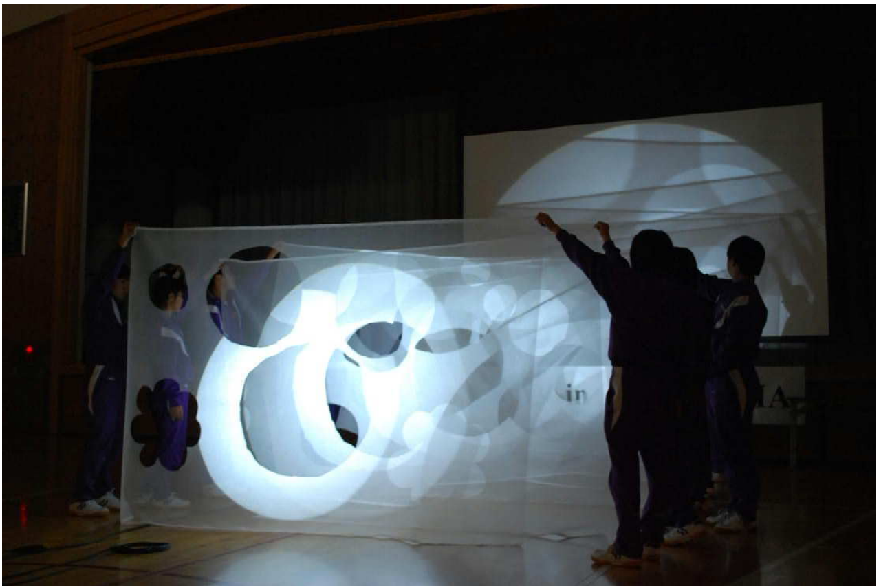
The Museum of Modern Art, Ibaraki 茨城県近代美術館