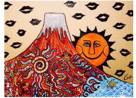
Red fuji (2020)