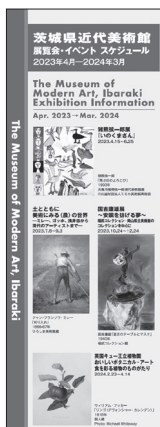
茨城県近代美術館 展覧会イベント スケジュール 2023年4月-2024年3月 2023(令和5)年3月14日