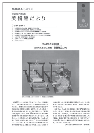
美術館だより No.123 2022(令和4)年9月30日