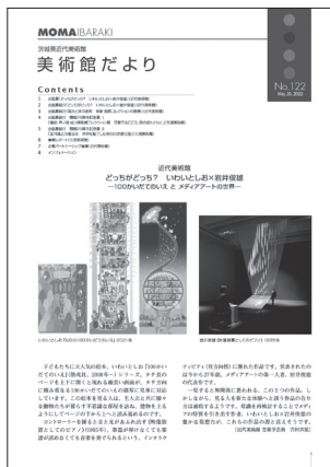
美術館だより No.122 2022(令和4)年5月20日