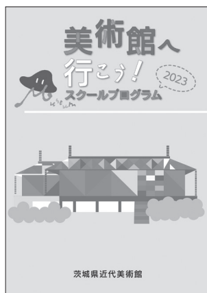
「美術館へ行こう！」 (学校むけ小冊子) 2023(令和5)年3月31日