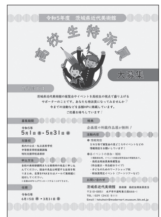
高校生特派員チラシ 2023(令和5)年3月31日