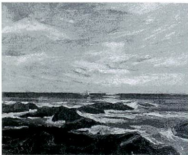
「大洗風景」 昭和18年(1943) 油彩・麻布 50×61cm 作者寄贈