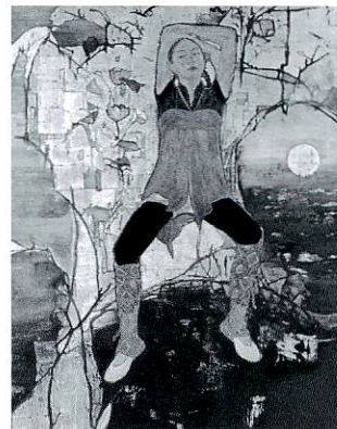
「忘れ物ノ行方」 平成17年(2005) 紙本・彩色 225×180cm 再興第90回院展 (第11回天心記念茨城賞) 平成18年度作者より 茨城県に寄贈