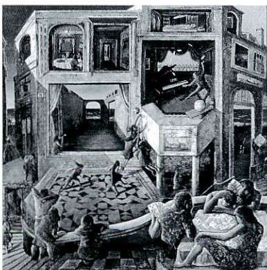
「午睡」 平成4年(1992) 油彩・麻布 162×162cm 第46回女流画家協会展 作者寄贈