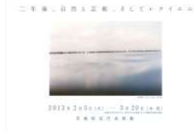
A4 巻き三つ折り予告チラシ