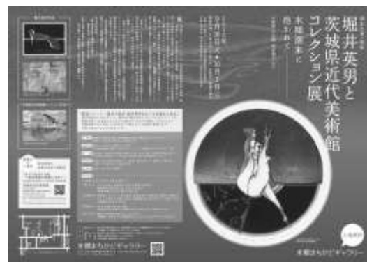
チラシ A3 二つ折り