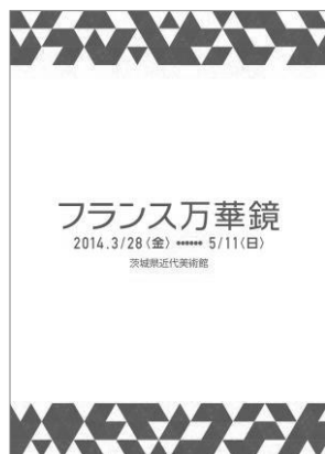
解説パンフレット