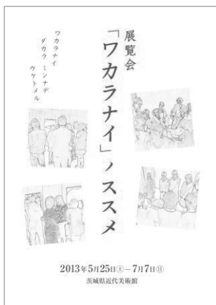
解説リーフレット