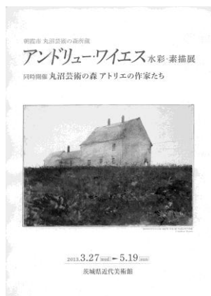
解説リーフレット