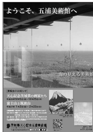
チラシA3(二ツ折・第2回、3回統合版)・表紙(左)、中面(右)