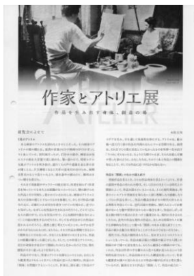
解説パンフレット