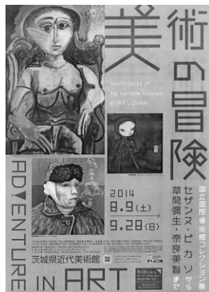
ポスター B1, B2