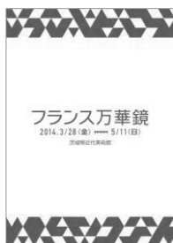
解説パンフレット