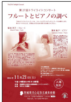
第 27 回トワイライトコンサートチラシ(A4)