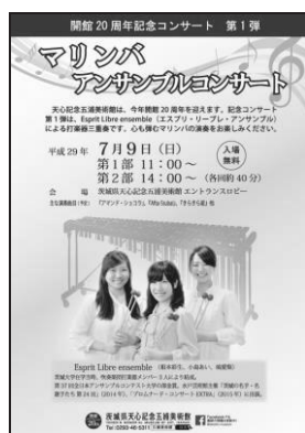
「マリンバアンサンブル コンサート」チラシ