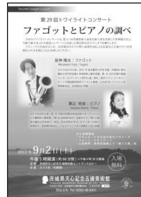
第29回トワイライトコンサート 「ファゴットとピアノの調べ」チラシ