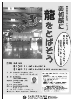
ワークショップ「美術館に龍を とぼそう」チラシ