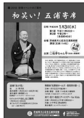
新春イベントチラシ