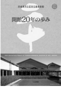
開館 20 年の歩み (A4 8 頁)