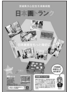
日本画トランクチラシ