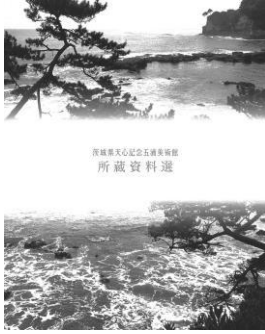
所蔵資料選 (縦 28 × 横 22.6 cm 111 頁)