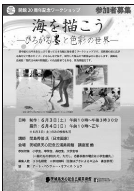
ワークショップ「海を描こう」 チラシ