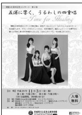
「五浦に響く、うるわしの四 重唱〜Time for Healing 〜」チラシ