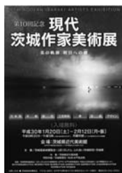
ポスター B2, チラシ A4