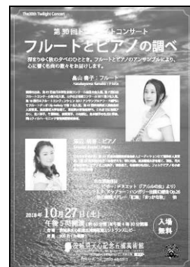
トワイライトコンサート「フルートとピアノの調べ」チラシ