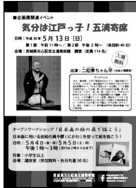
「気分は江戸っ子！五浦寄席」チラシ