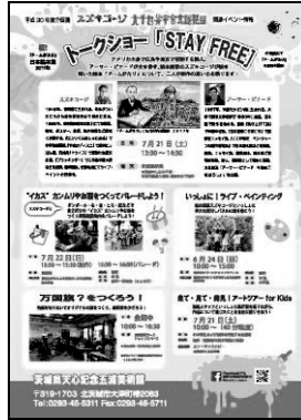
「スズキコージ展」イベントチラシ (表)