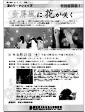
ワークショップ「金屏風に花が咲く」チラシ