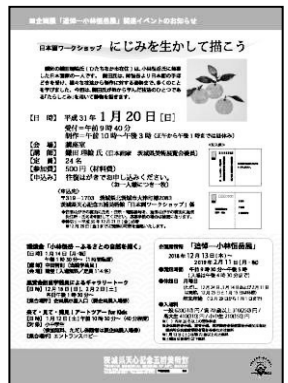
ワークショップ「にじみを生かして描こう」チラシ