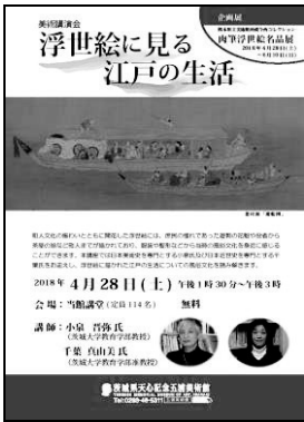
美術講演会「浮世絵に見る江戸の生活」チラシ