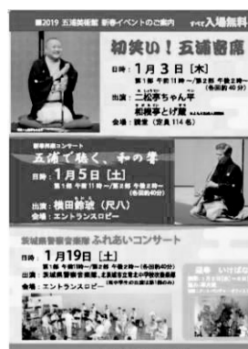
新春イベントチラシ