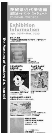
展覧会イベントスケジュール