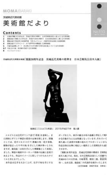
美術館だより No. 110