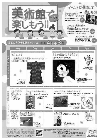
茨城県近代美術館スケジュールカレンダー 「美術館で楽しもう！」 (子ども向け年間スケジュール)