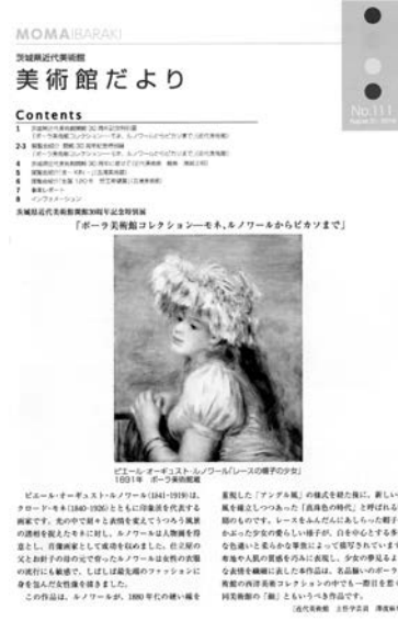
美術館だより No. 111