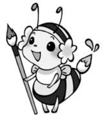
ブログキャラクター「きんびー」