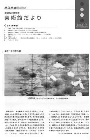
美術館だより No. 112