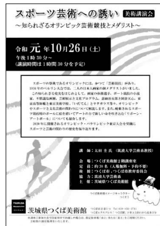
美術講演会チラシ