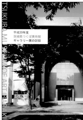
平成30年度ギャラリー展の記録