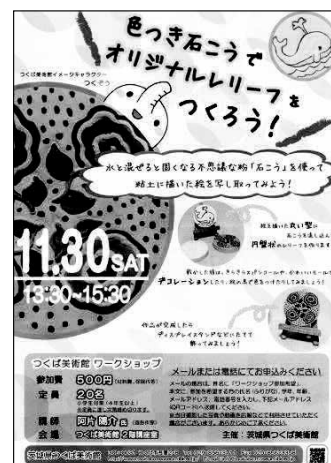
「色つき石こう WS」チラシ