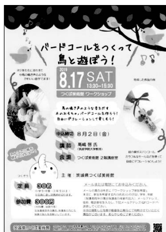
「バードコール WS」チラシ