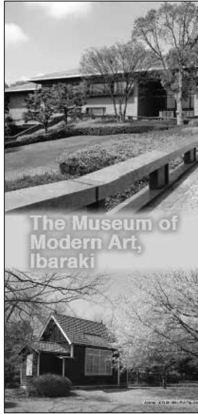
茨城県近代美術館リーフレット (英語版)