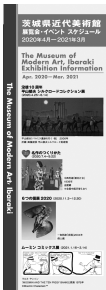
茨城県近代美術館 展覧会・イベントスケジュール