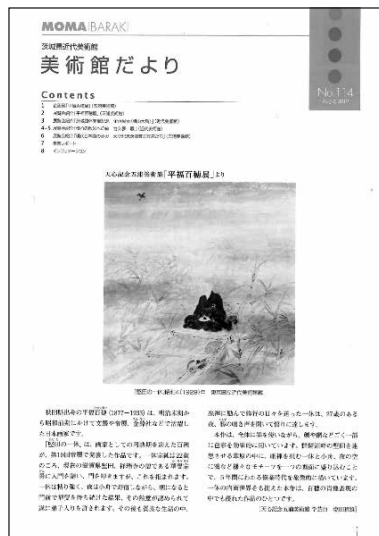
美術館だより No. 114