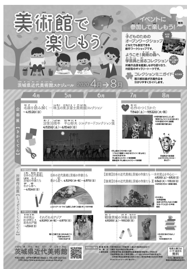
「美術館で楽しもう！」 (子ども向けスケジュール)