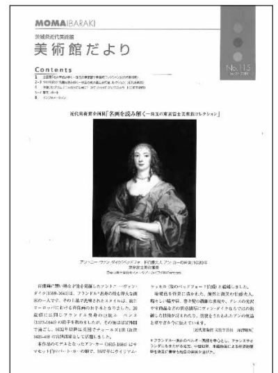
美術館だより No. 115