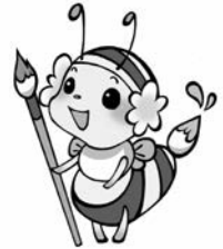
ブログキャラクター「きんぴー」