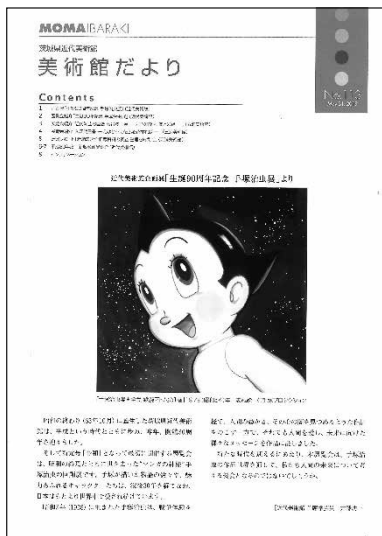
美術館だより No. 113