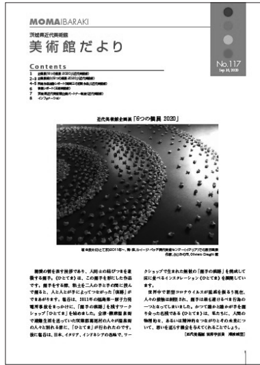
美術館だより No. 117