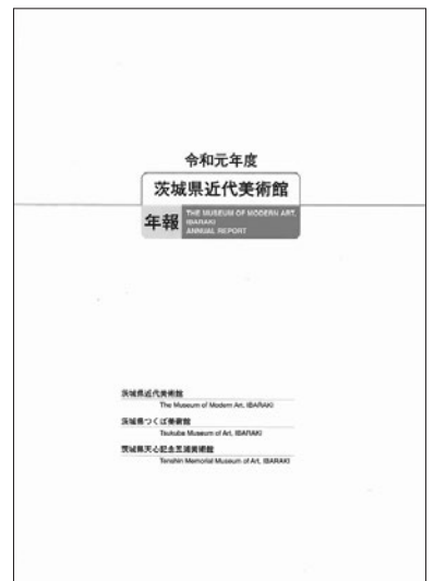
令和元年度 茨城県近代美術館 年報