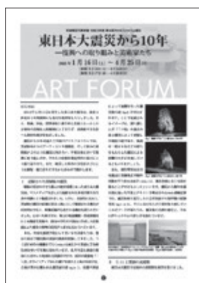
鑑賞リーフレット A4(二つ折り)