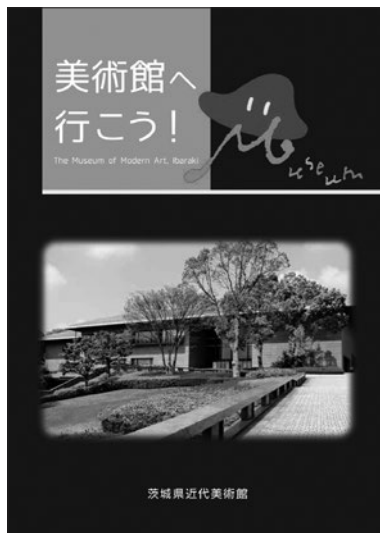
「美術館へ行こう！」 (学校向け小冊子)