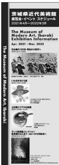
茨城県近代美術館 展覧会イベントスケジュール 2021年4月-2022年3月