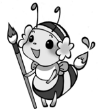
ブログキャラクター「きんぴー」