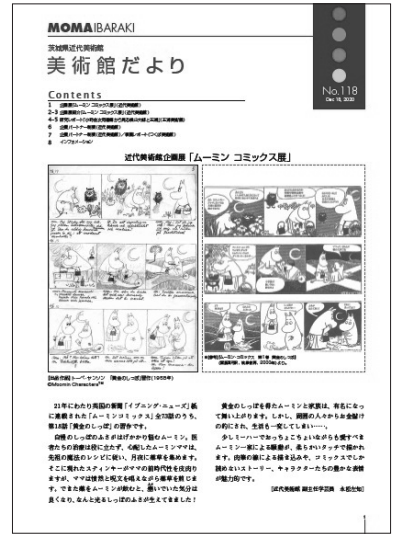
美術館だより No. 118