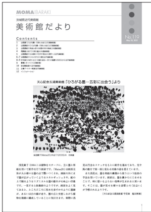
美術館だより No. 119 2021(令和3)年5月28日