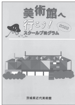
「美術館へ行こう！」 (学校むけ小冊子) 2022(令和4)年3月31日