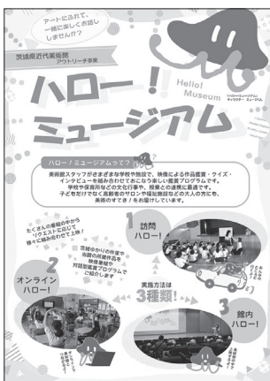
ハロー！ミュージアム チラシ 2022(令和4)年3月31日