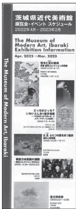
茨城県近代美術館 展覧会イベント スケジュール 2022年4月～2023年3月 2022(令和4)年3月14日