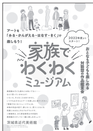
家族でわくわくミュージアム チラシ 2022(令和4)年3月31日