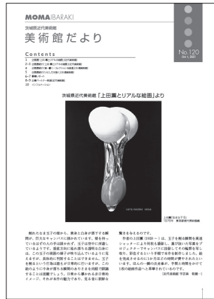
美術館だより No. 120 2021(令和3)年10月1日