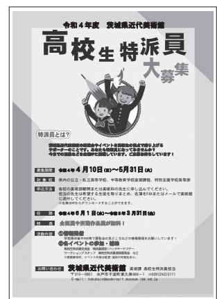
高校生特派員チラシ 2022(令和4)年3月31日