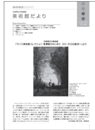
美術館だより No. 121 2022(令和4)年1月7日