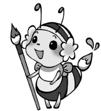
ブログキャラクター「金ぴー」