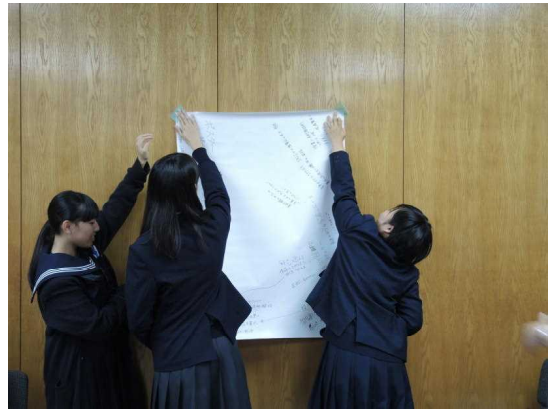
模造紙を張り出しました