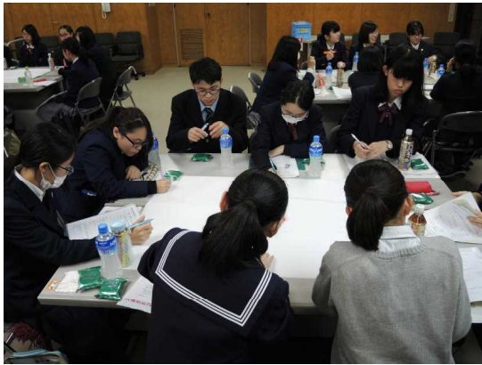
それぞれのアイデアを模造紙に書き出している様子