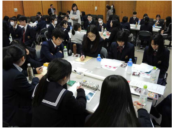
皆さん、真剣に考え中！