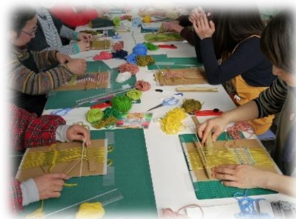
ワークショップイメージ