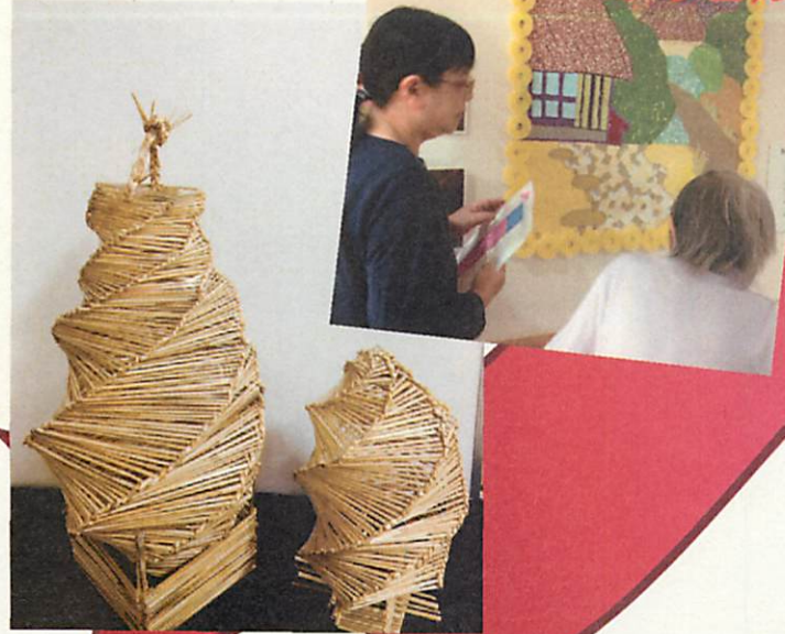
昔懐かしい、虫籠の作品！！