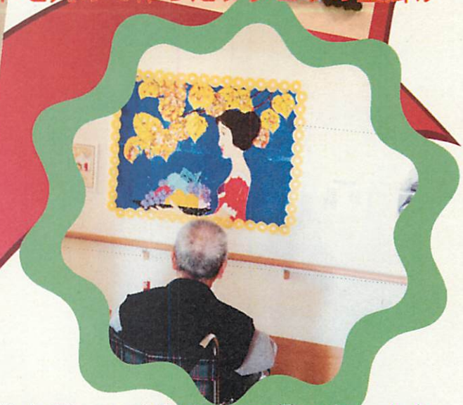
竹久夢二の布貼り絵の前でうっとり