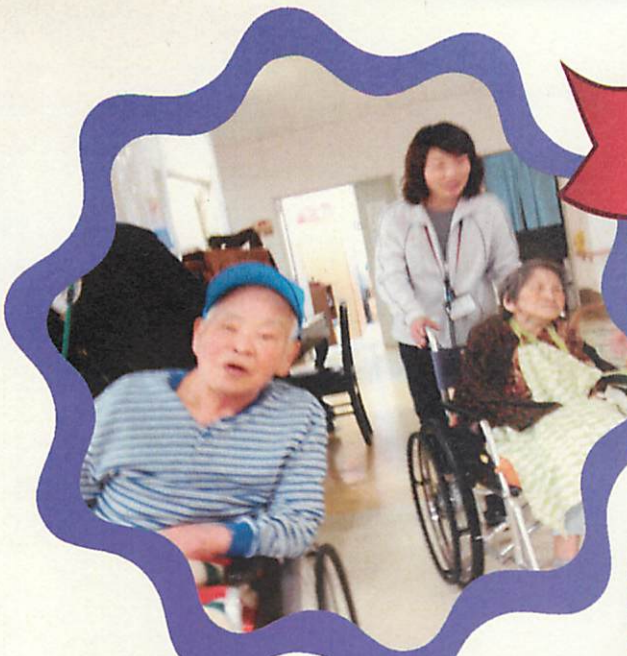
施設内の展示作品を巡る鑑賞ツアー！