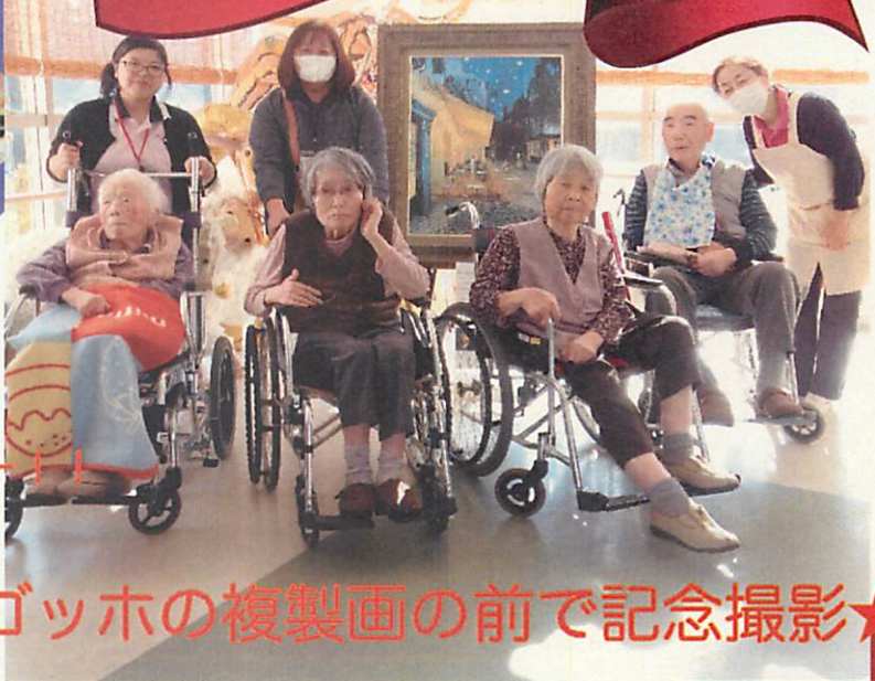
ゴッホの複製画の前で記念撮影★