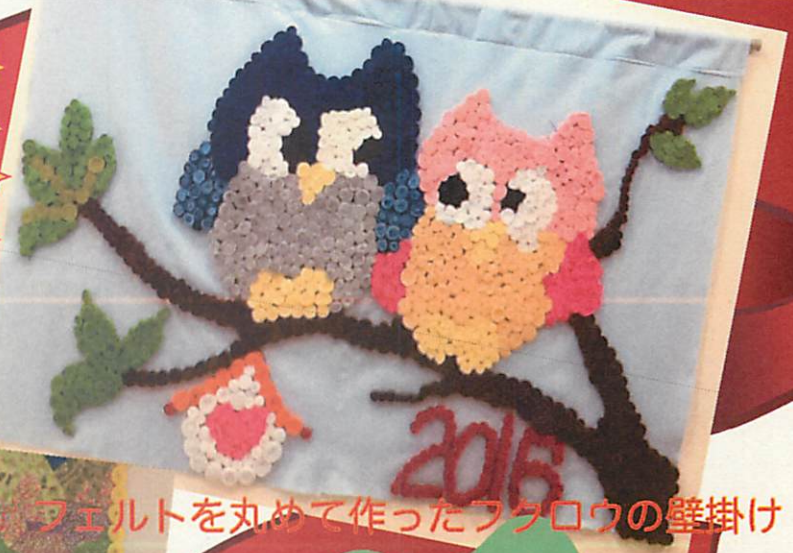
フェルトを丸めて作ったフクロウの壁掛け