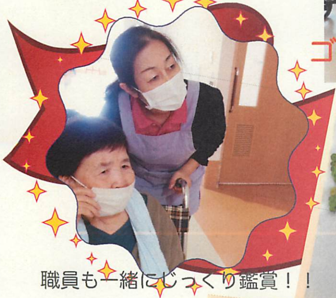
職員も一緒にじっくり鑑賞！！