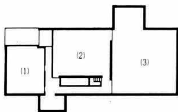
地下 B1 FLOOR