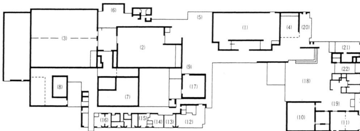
1階 1ST FLOOR