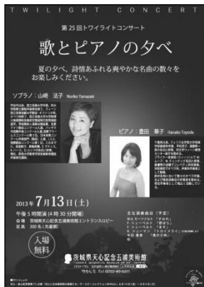
第25回トワイライトコンサート「歌とピアノの夕べ」チラシ(A4)