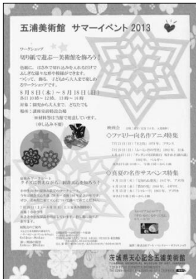
サマーイベント2013チラシ(A4)