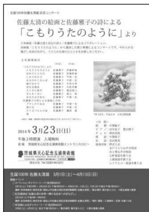
佐藤太清展記念コンサートチラシ(A4)