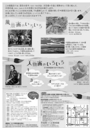
チラシ A4(学校配布用)