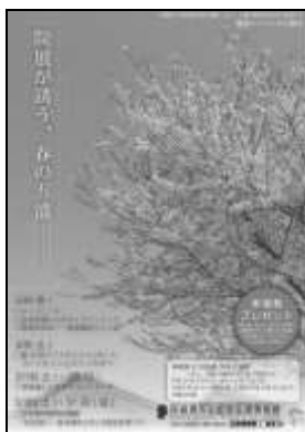
企画展「再興第97回院展 茨城五浦展」 関連イベントチラシ(A4)