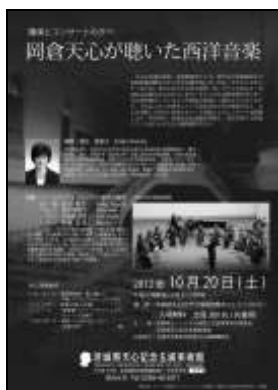
講演とコンサートのタベ「岡倉天心が聴いた西洋音楽」 チラシ(A4)